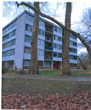
Photo 2 Arrière du bâtiment.