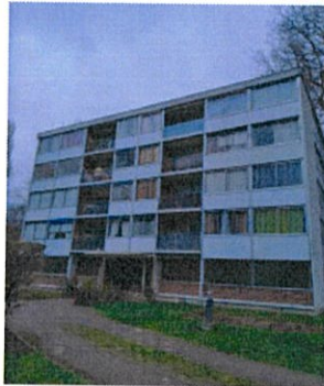
Photo 1 Avant du bâtiment.