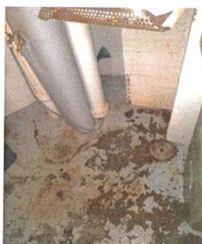
Photo 3 Le siphon de sol d'eaux usées du local ordures-ménagères 1 est raccordé au réseau public d'eaux pluviales.