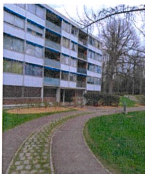
Photo 1 Avant du bâtiment.