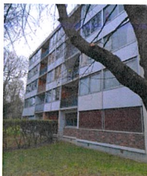
Photo 2 Arrière du bâtiment.